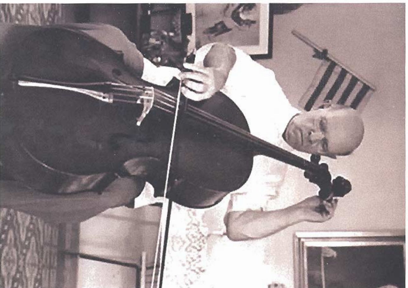
Pau Casals en Puerto Rico en el año 1967

UNIVERSIDAD DE PUERTO RICO SALA DE EXPOSICIÓN, COLECCIÓN DE LAS ARTES 24 FEBRERO 2009, 7:00PM